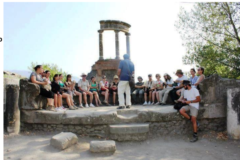
Visita guiada a Pompeya, Necropolis Porta Herculano