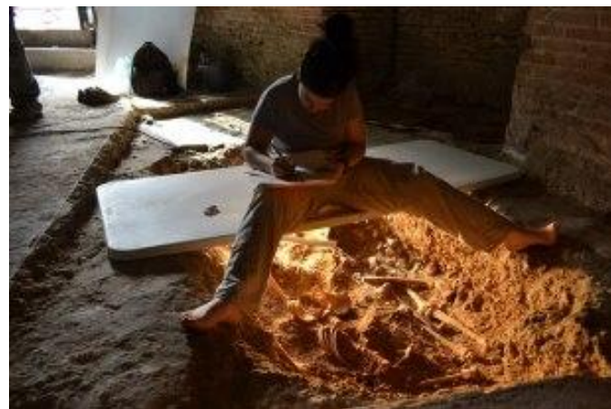
Documentación del Osario Mausoleo Romano de Acilii Glabrioni (Alife)

Visita Guiada a Telesia..Traslado de Alife a Aeropuerto