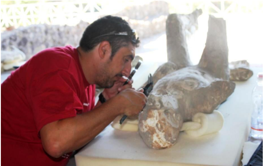
Analisis de los esqueletos en el interior de los moldes de yeso

Mañana Excavación del Foro Romano de Alife Tarde Seminario: Contexto histórico y arqueológico de la Campania. Samnitas y Romanos Labores post-excavación