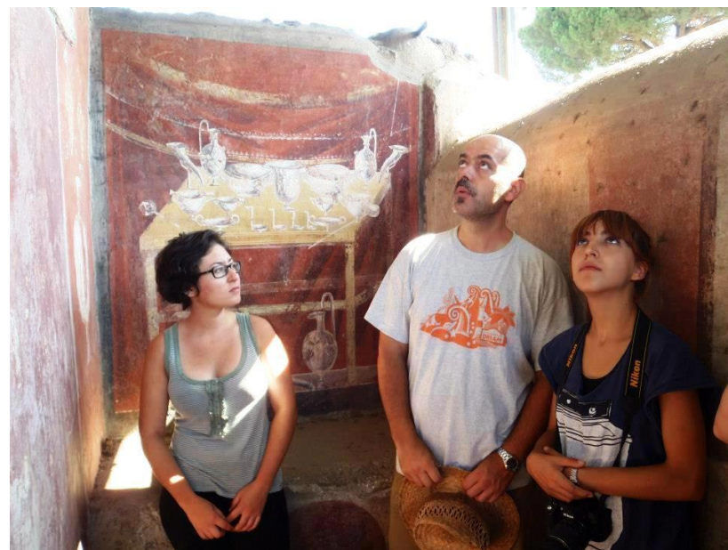
Visita guiada a Pompeya, Interior de la tumba de Vestorius Priscus

• Visita Guiada por arqueólogos especialistas a Herculano y al Museo Virtual de Herculano (la entrada al Museo Virtual privado de Herculano no está incluida)