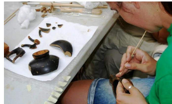
Materiales de l deposito funerario de las tumbas samnitas de Alife