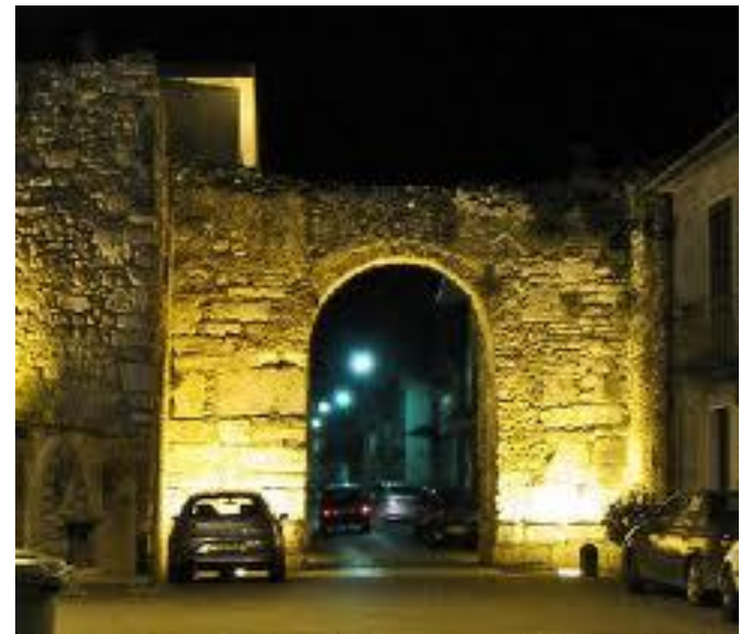
Muralla Romana de Alife

•Prácticas con huesos humanos y esqueletos. Bioantropología, Análisis osteológico y paleopatológico. Registro Osteométrico y morfológico. Estimación de Sexo, edad y estatura. Análisis de los huesos humanos del Mausoleo Romano de Acilii Glabrioni