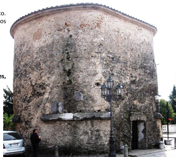
Mausoleo Romano de Acilii Glabrioni (Alife)